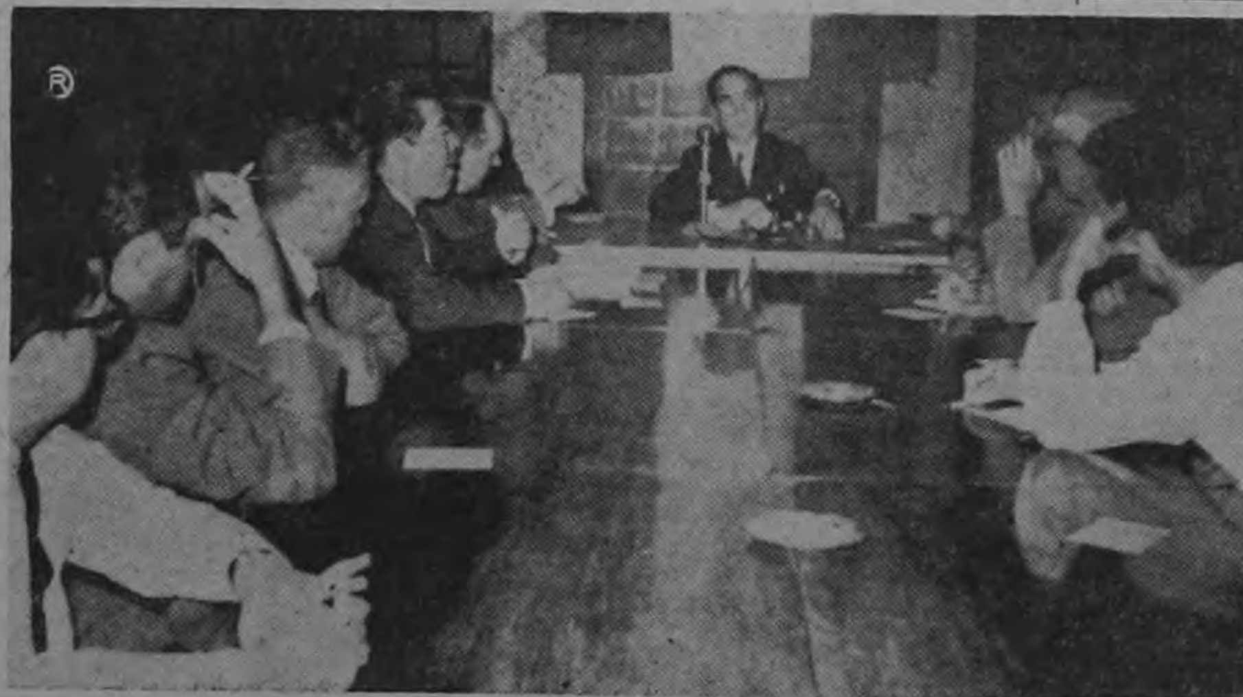
La gráfica recoge el momento en que José Figueres da a conocer a la prensa nacional y extranjera el texto de la Declaración de San José, suscrita por partidos populares democráticos de Latinoamérica. La importante reunión se efectuó en las oficinas del Partido Liberación Nacional.